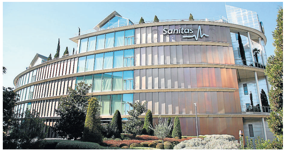
◆ SANITAS Se adapta a las necesidades económicas y asistenciales de los clientes.

LA COMPAÑÍA, QUE TIENE ACUERDOS CON LOS PRINCIPALES HOSPITALES DE LA COMUNIDAD, HA INCREMENTADO DURANTE 2012 SU CUADRO MÉDICO EN LAS TRES PROVINCIAS ARAGONESAS