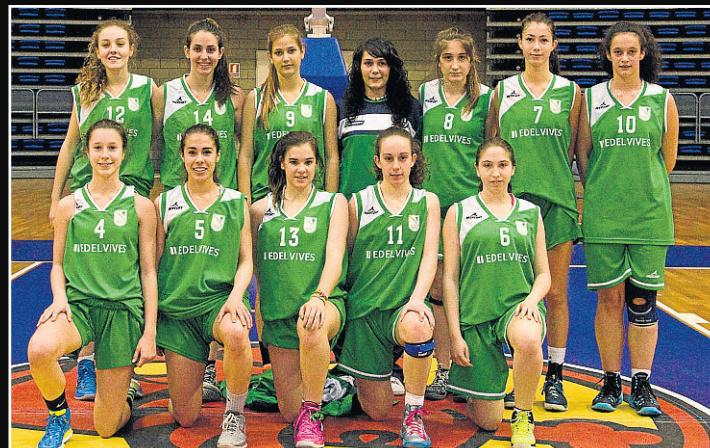
Stadium Casablanca cadete. Las verderolas cuajaron un buen Campeonato de España en el que llegaron a octavos y en el que destacó su victoria frente al Uni Girona (56-49).