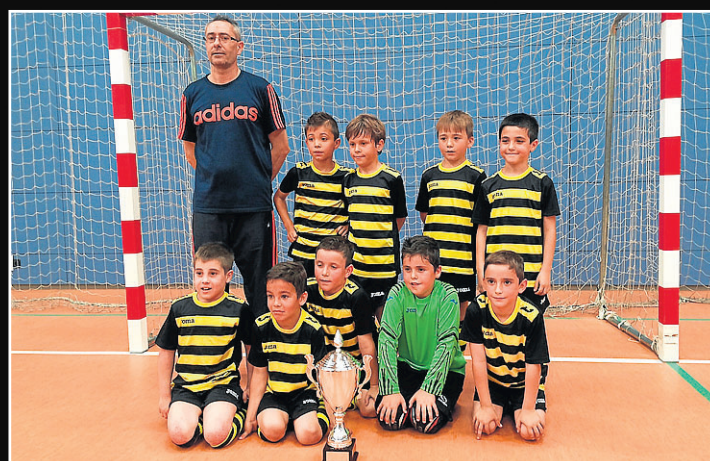
La Cigüeña Iniciación. Los chicos del barrio de Monzalbarba de Zaragoza han logrado el triplete; campeones de Liga, Copa y Torneo de Reyes y han acabado invictos en la temporada.