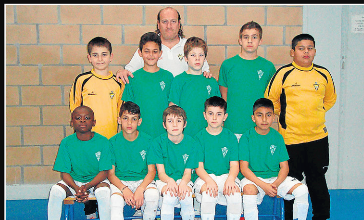
Alevín Las Delicias. Los chicos del populoso barrio zaragozano de Las Delicias están brillando a un buen nivel en la pista de juego en el tramo final de temporada.