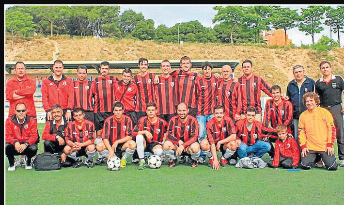
AD Urriés. El equipo de las Cinco Villas, después de una meritoria temporada en la liga regular, sigue adelante en la copa. Jugadores, técnicos y presidente no renuncian a nada en la competición.